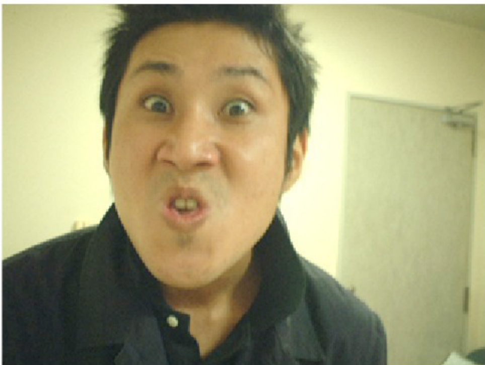
Media Player版 ▶01