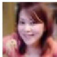
by Sumiko Umeno

彼が食べてないのも悲しかったけど、ねえ、すすめられた皆様まで何で食べないの？何だか恥ずかしいケーキエピソードでありました…。