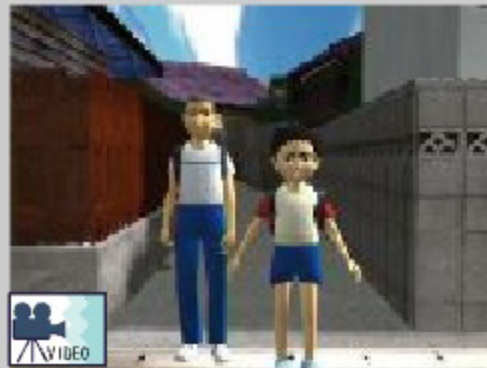
作品名：まわり道 作者名：松尾年憲