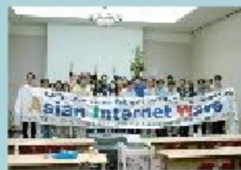
▲「AIW2003に参加した東明情報大学の皆さん(釜山会場)」

先月、九州電力や西日本新聞などが、福岡で「釜山間を光回線ではないだITシムを実施。コアアプでもネット中継された。私は釜