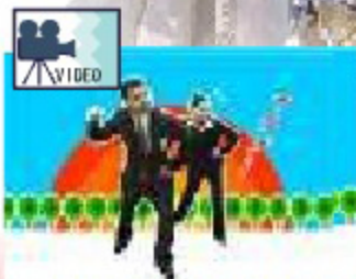
▲就職/スパルタ研修 なんでだろ?