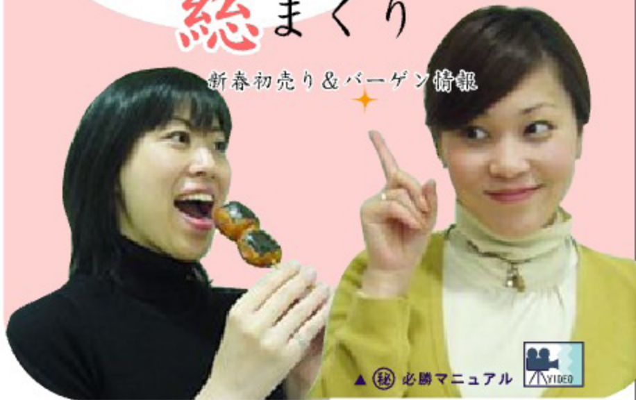
▲(秘) 必勝マニュアル